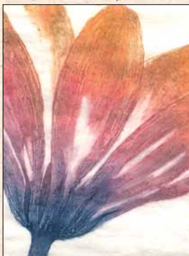
Noora Sarolainen, 2009