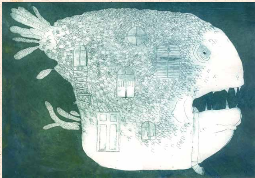
Aino Simola, 2009